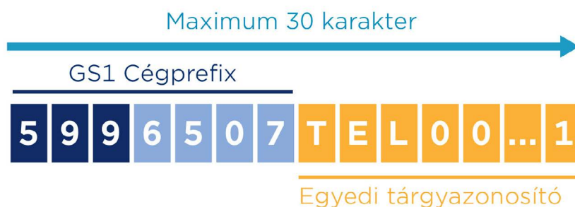
1.ábra: A GIAI felépítése 7 számjegyes Cégprefix példájával

A GIAI egy maximum 30 karakter hosszú azonosító szám. GS1 Cégprefixszel kezdődik, amely biztosítja a globális egyediséget. Ezt egy egyedi tárgyazonosító követi, amely alfanumerikus karakterekből áll. Ez utóbbi az a tartomány, amit a GIAI szám kiosztója szabadon változtathat.