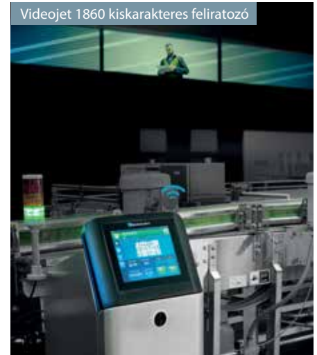
Videojet 1860 kiskarakteres feliratozó

Vevőink támogatásának kulcsfontosságú eleme az a szervizhálózat is, amelybe közel 20 ügyfélszolgálati- és szervizmunkatárs tartozik. Országos lefedettségünk lehetővé teszi, hogy gyorsan és rugalmasan reagáljunk a felmerülő karbantartási és javítási igényekre.