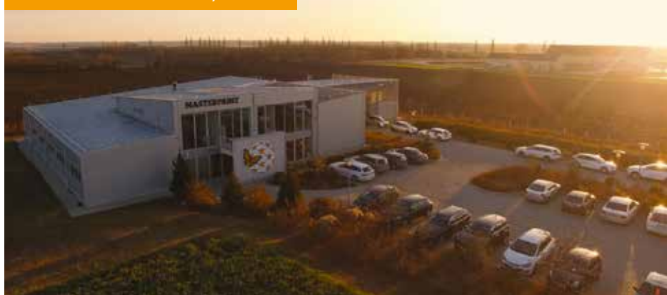
A MASTERPRINT KÖZPONT, IVÁNCSA