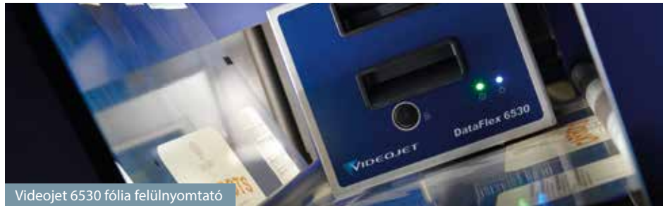
Videojet 6530 fólia felülnyomató

A FOBA rendelkezik az egyik legnagyobb lézertechnológiai- és alkalmazási tapasztalattal az iparágában, neve egyet jelent az innovatív, ügyfélreszabott megoldásokkal. A több fajta munkaállomás és a számos beépíthető lézerrendszer lehetővé teszi, hogy a megfelelő igényre szabott megoldást alakíthassuk ki.